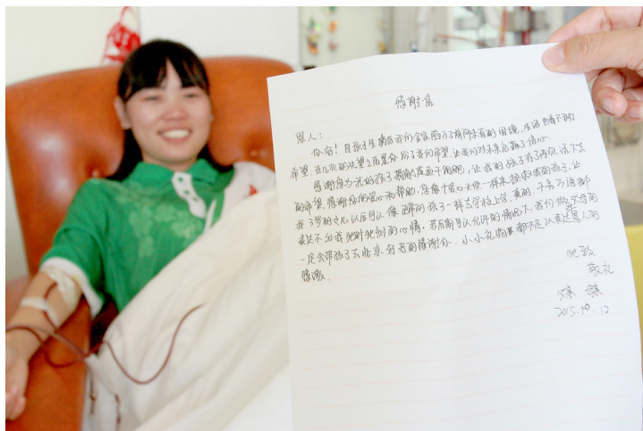
◀ ▲两位充满爱心、阳光健康的捐献者