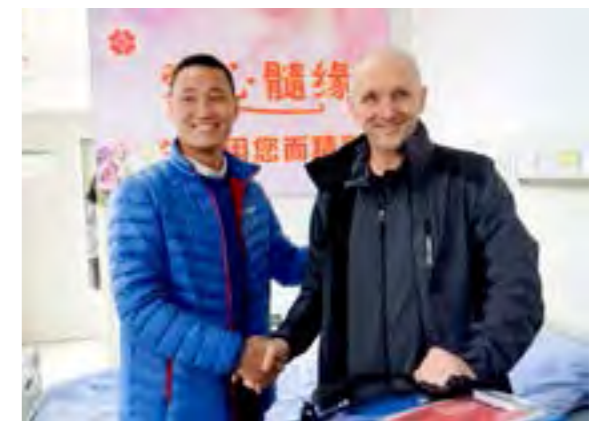
周先生在捐献完成后于德国志愿者合影

1月16日周先生完成捐献后，德国志愿者背着7.5公斤重的恒温箱近24小时奔波在运送途中，18日下午造血干细胞可以到达雅典，输注到患者体内。“生命种子”从中国大陆穿越近万公里到了西方文明的发源地希腊，种植到患者的体内，她的生命将被挽救。同时，伴随着造血干细胞一起，中国人民的奉献精神 and 深厚情谊也将带到希腊，播撒到海外华人和希腊人民的心田。🌸