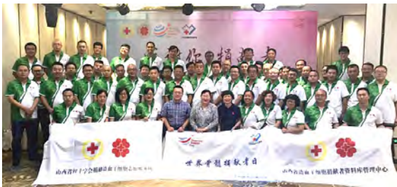
山西·志愿服务培训