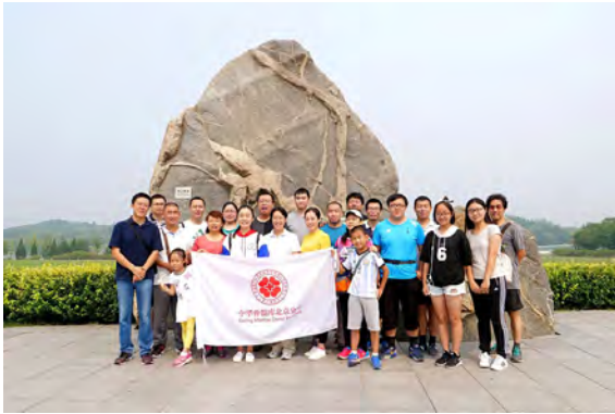
北京·捐献者健步走