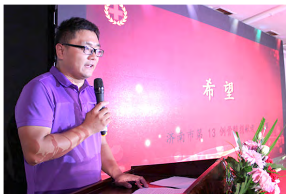
山东·捐献故事分享