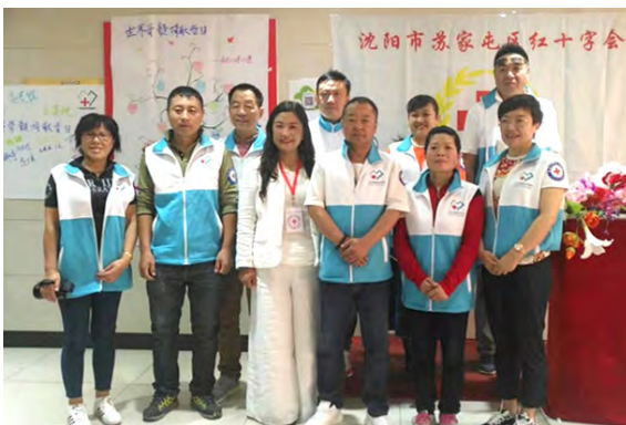
辽宁·志愿者交流座谈会