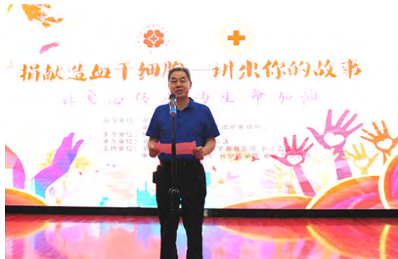
湖南·捐献故事巡讲