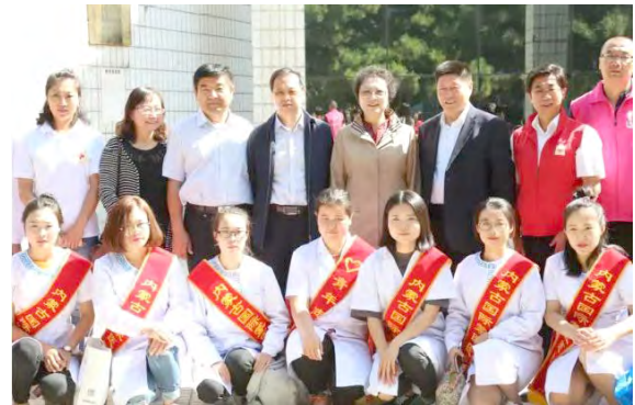
内蒙古·志愿服务宣传活动