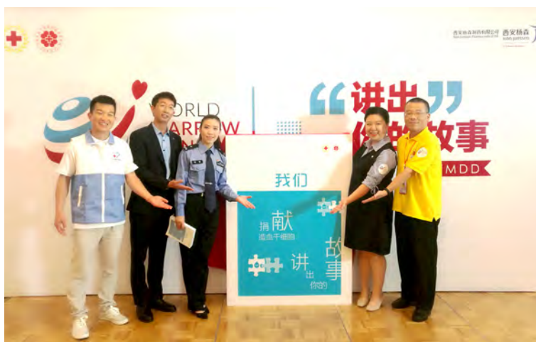
五位故事分享捐献者合影