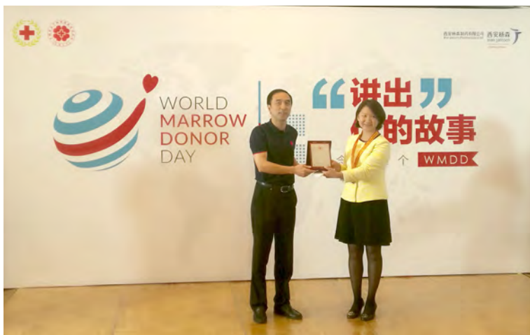
王海京副会长（左）为西安杨森颁发“中国红十字人道博爱”奖章