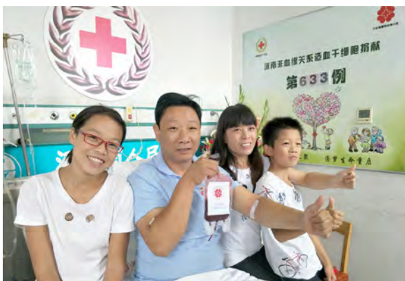
程先生一家人共享救人的快乐

“都是为人父母的，能体会到孩子生病了父母有多心焦，只要需要，这个忙一定会帮。” 🌸