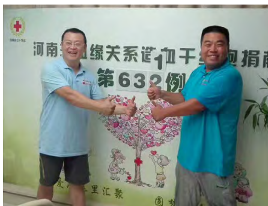
李先生、许先生捐献前相互加油