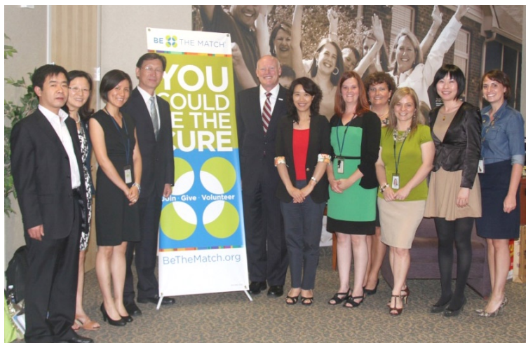
▲ 中华骨髓库访问团与美国骨髓库人员合影。

本次访问主要是深入了解美国和加拿大骨髓库的现状，并分享和交换在骨髓库建设，实验室管理，网络信息系统建设，脐血库管理，志愿者招募和志愿者管理方面的经验，有利于中华骨髓库与美国骨髓库及加拿大骨髓库的深入合作，提高合作效率和合作力度。同时本次访问也深度了解美国骨髓库合作实验室的工作情况和与骨髓库的合作模式；初步了解了美国器官捐献工作的流程和美国人体器官获取组织的工作状况，了解了加拿大血液服务系统开展骨髓库供者招募工作的情况,对中华骨髓库的服务工作有一定的借鉴意义。