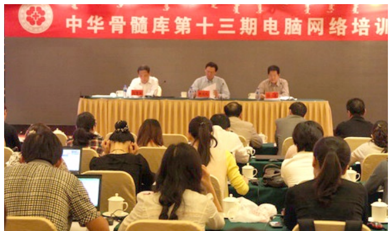
▲ 第13期IT网络培训班现场。

按计划，第14期IT网络培训班在9月13-14日在同一地点举办，培训对象为与中华骨髓库签约合作的移植/采集医院IT系统使用人员。